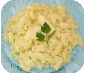
SALADE DE PATES AU BASILIC