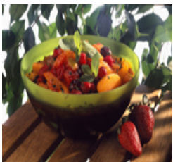
SALADE DE FRUITS FRAIS A LA MENTHE