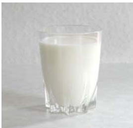
LAIT AROMATISE FRAMBROISE