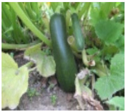
COURGETTES SAUTEES AUX HERBES DE PROVENCE